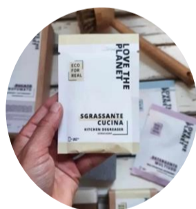
I DETERSIVI IN POLVERE DI ECO FOR REAL