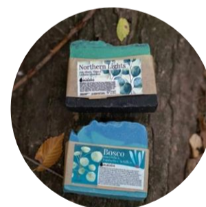
I SAPONI DI MONTAGNA DI EUKALIA

Aggiungi il prodotto che ti interessa alla lista!