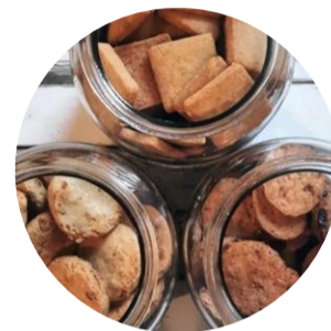
I BISCOTTI ARTIGIANALI SENZA ZUCCHERO