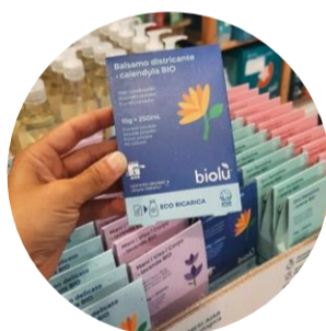
I DETERGENTI HOME MADE DI BIOL'U'