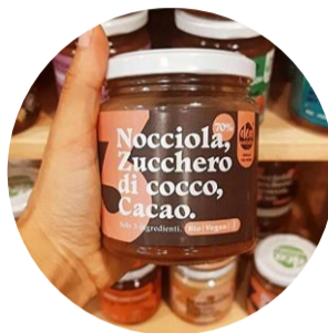
LE CREME SPALMABILI DI DEA NOCCIOLA