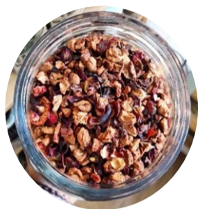
I TE' DELL'AUTUNNO E DELL'INVERNO